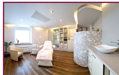
Salon U kamínku