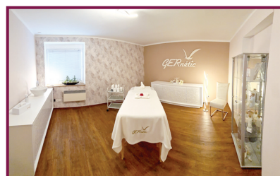
Salon U fontánky