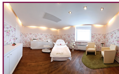
Salon U květinčky